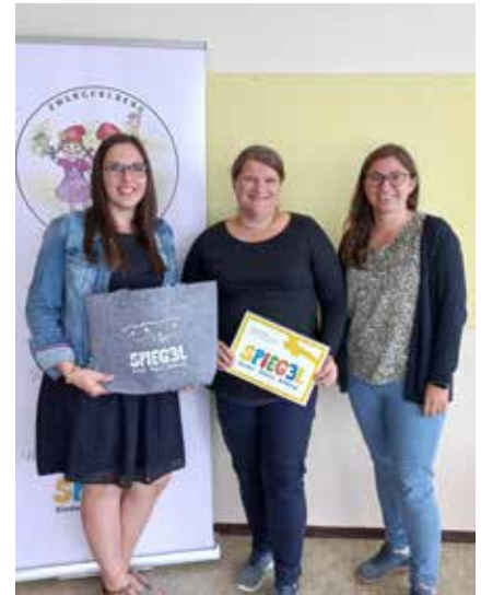
Euer Team vom „Zwergerlberg“ Spiegeltreffpunkt Altenberg bei Linz

Alle Details zu unseren Veranstaltungen, Informationen und Anmeldungen gibt's auf unserer Homepage ( www.zwergerlberg.com )